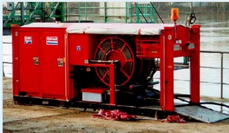
Pumpenmodul des Wasserfördersystems im Einsatz.