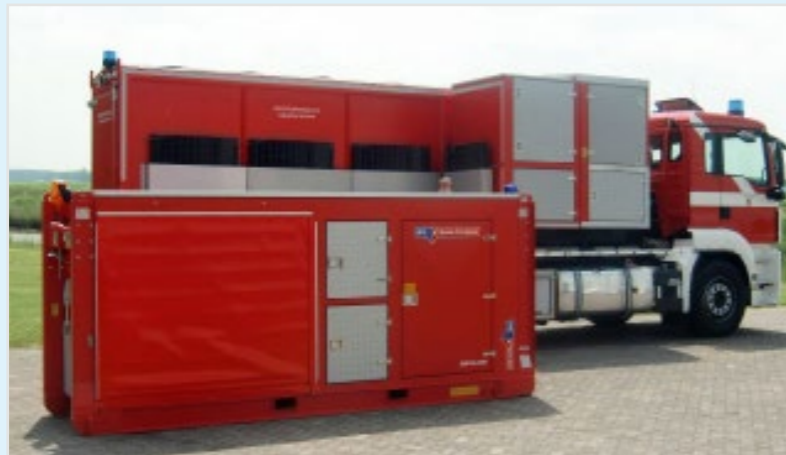
AB-WFS mit abgesetztem Pumpenmodul.