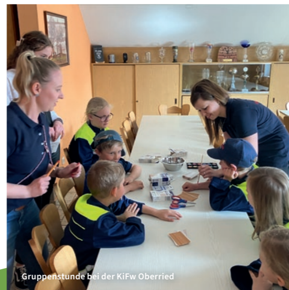
Gruppenstunde bei der KiFw Oberried