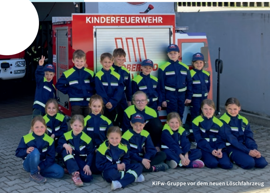
KiFw-Gruppe vor dem neuen Löschfahrzeug

Üben wie die Großen: Für ihre Kinderfeuerwehr hat die niederbayerische FF OBERRIED ein Löschfahrzeug gebaut – sogar mit Blaulicht, Dachwerfer und 200-Liter-Wassertank.