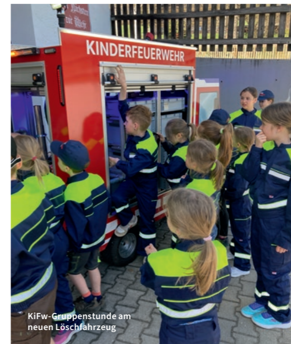
KiFw-Gruppenstunde am neuen Löschfahrzeug