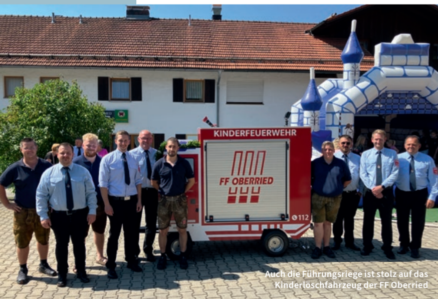
Auch die Führungsriege ist stolz auf das Kindertöschfahrzeug der FF Oberried

K inder lernen viel durch Nachahmung. Umso besser, wenn sie dafür die entsprechenden Voraussetzungen bekommen: Bei der Freiwilligen Feuerwehr Oberried im Landkreis Regen haben die Aktiven ein Mini-Löschfahrzeug für die Kinderfeuerwehr gebaut. Wie bei den großen Löschfahrzeugen sind Rolll Tore verbaut, hinter denen das Werkzeug für den (Kinder-) Einsatz verstaut ist: Unter anderem eine Kindermotorsäge, Handlampen sowie Kellen und Pylonen zur Verkehrsabsicherung. Der